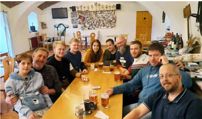
V Buzicích se u karetního stolu sešla řada skaličanských hráčů

Turnaj v karetní hře prší v Hospodě u Čiláka v Buzicích absolvovalo na konci listopadu celkem 26 hráčů, z toho 10 zástupců Skaličan! V příjemné předadventní atmosféře útulné hospůdky proběhly lité boje, ze kterých nakonec vykristalizovalo pořadí, které bylo nakloněno skaličanským.