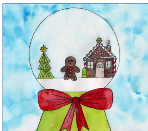
Sofie Vrbová VI. A