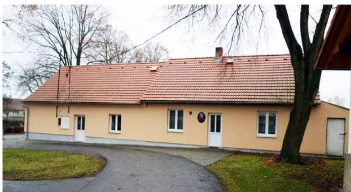
Budova obecního úřadu Lom

dvojnásobek. Nicméně již máme konkrétní řešení a věřím, že se tento záměr povede dotáhnout do konce. Mezi další plány letošního roku patří vybudování fotovoltaické elektrárny s možností dodávat el. energii do sítě. Máme již zpracované předběžné náklady této akce a větší část by měly pokrýt dotace. V rámci „Programu obnovy venkova“ budeme pak žádat o dotace na rekonstrukci sociálního zařízení v kabinách TJ Lom. Další z plánů je získání části pozemku v osadě Mířeč, abychom mohli postavit novou zvoničku, doplnění dopravního značení a úprava veřejného prostranství. V neposlední řadě nás čeká oprava komunikace III/1215 směrem na Mirovice patřící SÚS Jk vedenou přes obec Lom, během které bude opravena část kanalizace.