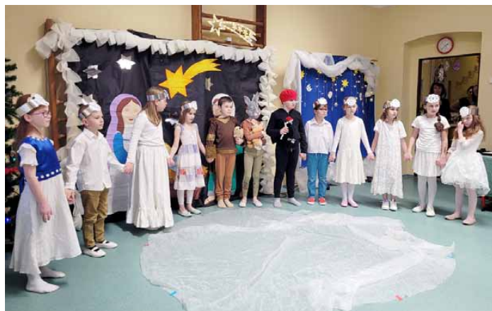
Vánoční koncert