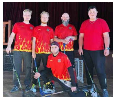
Skaličanský tým v Myšticích