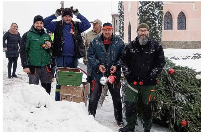
Zdobení vánočního stromu ve Skaličanech

Sousedky nám připravily rybí pochoutky a v obecním domě bylo opět dobře! Děkujeme všem, kteří se zúčastnili a zejména všem, kteří přiložili ruce k dílu, těm co strom přivezli i všem, kteří stromek zdobili.