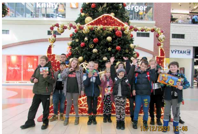
V OLYMPII PLZEŇ

Nejmladší žáci například vyšívali hvězdičky na připravený karton a výrobek vkládali do průhledného sáčku. Pracovali také s papírem při obkreslování šablony anděla. Vystříhávali, skládali, lepili a nakonec přidělávali závěs hotového výrobku. Nejstarší chlapci zase neopustili školní dílnu, ze které se po celé 2 dny ozývaly hlasité zvuky připomínající řezání a pilování dřeva. Jejich polotovary pak byly dále zpracovávány