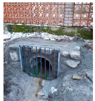
Kvalitní dílo ve Skaličanech, nátoková část propustku

Na přelomu listopadu a prosince proběhla v horní části obce oprava, resp. výměna silničního propustku mezi č.p. 4 a č.p. 15. V rámci této akce došlo k realizaci precizního díla prostřednictvím dodavatelské firmy Reno Šumava, jejíž pracovníci provedli parádním způsobem skvělou stavbu a v úzké součinnosti s investorem stavby, kterým byla Správa a údržba silnic Jihočeského kraje, místo uvedli do mnohem lepšího a vyhovujícího stavu než tomu tak bylo před zahájením stavby. Dokončeným dílem by se mimo jiné měly zlepšit odtokové poměry v této lokalitě. Děkujeme citovaným institucím za perfektně odvedenou práci!