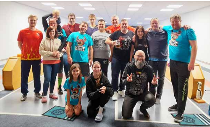
Zbylí účastníci na konci kužkového klání

by nepochybně výrazně promluvili do konečného skóre, ale možná o to více bojovali ostatní přítomní a některé souboje byly opravdu třaskavé a napjaté. Celé odpoledne byl souboj poměrně vyrovnaný, ale skaličanští tentokrát, po loňské těsné prohře, nakonec zvítězili a připsali si tak rozhodující bod sportovní série roku 2023, kterou vyhráli 3:2 (skaličanští zvítězili v hokeji, fotbale a kužkách, buzičtí ve florbalu a nohejbale). Vítězství znamenalo první celkový historický triumf Skaličan v souboji o Lavor Cup, ale ve skutečnosti zvítězil každý, kdo měl chuť se našich společných klání účastnit. Účast skaličanských byla na kužkách i přes drobné organizační trable více než hojná a za to Vám všem patří velké, velké poděkování! Veliká omluva náleží i těm, kteří si nakonec vůbec nezahráli, ale svojí přítomností nás podpořili a byli připraveni do bojů zasáhnout, jednalo se o více než příjemné kamarádké setkání.