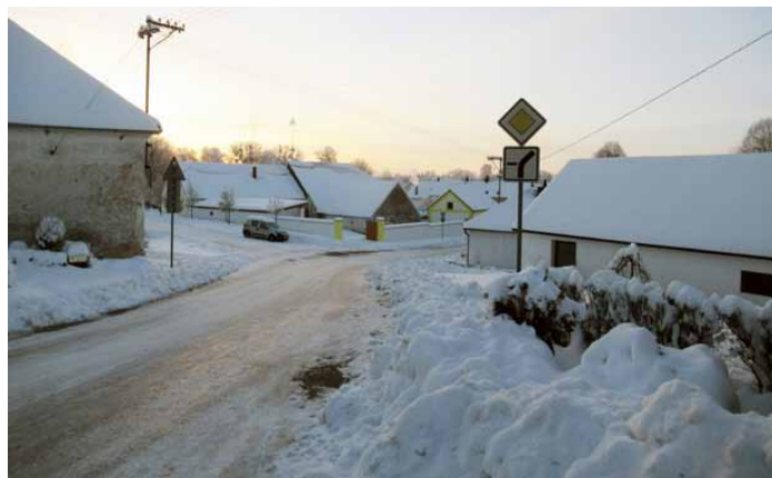
Kalamitní stav - silná sněhová nadílka a mráz -17C. 1-4-12.2023

V prosinci nás všechny potrápila silná nadílka sněhu, a to od pátku 1. 12. až do pondělí 4. 12. 2023, kdy u nás napadlo za dva dny 35 cm sněhu. Z počátku byl sníh mokrý a těžký, teploty se pohybovaly okolo nuly, za to v pondělí udeřil mráz -17°C. nadílka přišla v době rozsvícení vánočního stromu na návsi obce. Pro tuto akci byla sněhová kulisa nádherná. Ovšem pro úklid, kdy sníh neustále padal to bylo náročnější. I přesto se podařilo udržet všechny komunikace a obecní prostranství sjízdné a přístupné. Sníh však po skokovém oteplení v následujícím týdnu všechen roztál.