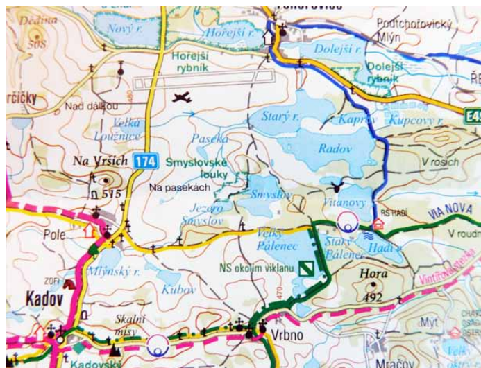
Mapka okolí s rybníkem Hadí

.... „U Blaníku se povede dvanáctidenní bitva, která zaplní tamní vyschlý potok krví, načež třináctého dne vyrazí Boží vojsko a pože ne nepřítel až ke Kolínu nad Rýnem. Tam se ztratí...“ ... „Blaníční rytíři neuchrání Prahu, kterou ustupující vojska vyplní a poboří, to není chyba velení, ale záměr Boží.“ ... „Proč ale Blaník? Dříve než se pokusíme nalézt krátkou a vyčerpávající odpověď,