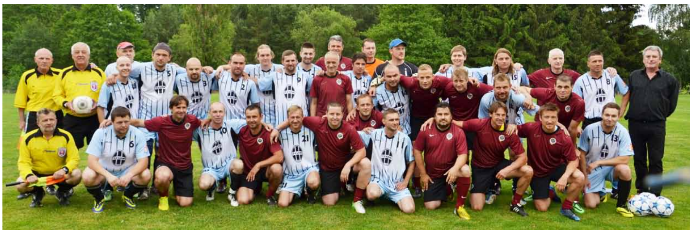
Oslava 50 let lomského fotbalu TJ Lom - AC Sparta Praha

Plánujeme uspořádání setkání rodáků, ale termín ještě nemáme stanovený. Co se týká investičních plánů, tak se stále jedná o prodloužení vodovodu z Neradova do Mířeče. Tato akce se nám kvůli některým vlastníkům pozemků, kteří neumožnili jeho vedení přes pozemky nepodařila uskutečnit a cenové náklady během této doby stouply na