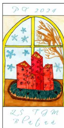
Ema Prokošová, 5. A