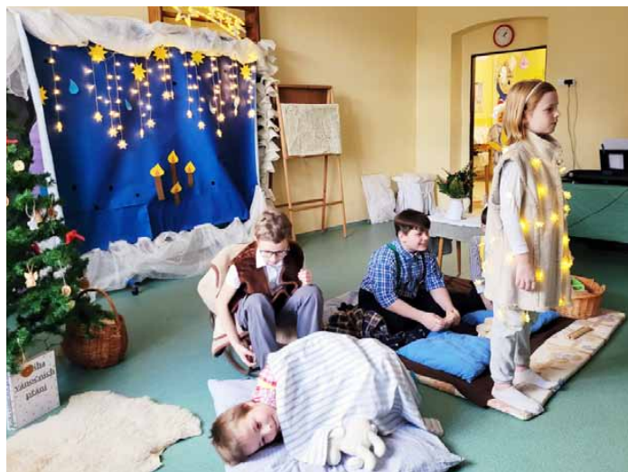
Dramatizace příběhu O Ježíškovi