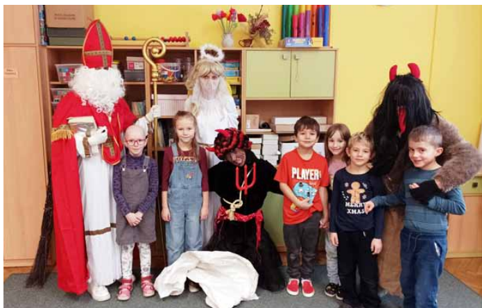
Mikulášská nadílka ve škole

Další důležitou akcí u nás ve škole byla 22. listopadu „První pomoc zážitkem“ pořádaná společností SORUDO. Děti si vyzkoušely, jak v různých krizových situacích reagovat, jak pomoci druhým, ale přitom nezapomenout ani na vlastní bezpečnost. Odpoledne program