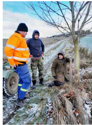
Úprava zabezpečení stromků

Během jednoho sobotního listopadového dopoledne proběhlo vylepšení ochrany stromků vysázených v dvoretické cestě před okusem a vytloukání zvěří. Liniová zezeň byla v minulosti vysázena podél několika obecních cest a místní hasičstvo ve spolupráci s nimrody se o stromy stará tak, aby v budoucnu vytvořily alej vzrostlých stromů. Pravidelně probíhají záhlívky a opravy ukotvení a zabezpečení odrostků. Ne na