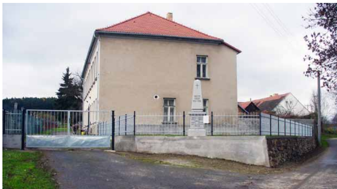
Budova staré školy čp.55

V roce 2024 bude obec realizovat projekty „Rekonstrukce zásobování TUV sociální budovy pro ATC-Milavy“, kde bude provedena instalace nového solárního ohřívání teplé vody pro kuchyňku a sprchy v kempu ATC-Milavy. Dále bude instalována Fotovoltaická elektrárna na budovu staré školy v obci, kde vyrobená energie bude sloužit pro napájení nočního osvětlení obce a přebytek bude komunitně spotřebován na jiných místech v obecních budovách. V současnosti se zpracovává projektová dokumentace na výstavbu zastřešeného a odhlučného stání na kontejnery na tříděný odpad. Projektčně se zpracovává výstavba kanalizace u čp.14 a připravují se možnosti provedení kanalizace okolo domů čp.39, čp.42, čp.52. Dále se pracuje na projektu opravy MK 4 C. Technicky a rozpočtově se pracuje na rekonstrukci společenského sálu čp.6 „Hospoda U Mostu“. V areálu ATC-Milavy bude v letošním roce vyměněna část střešní krytiny na budově čp.59 (pergola a hospoda). Současná krytina je již v havarijním stavu a do střechy zatéká. Zastupitelstvo obce přeje všem občanům do nastávajícího roku hodně štěstí a hlavně hodně zdraví.