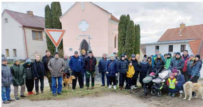
Na startu špacíru

Buzic. Letošní trasa byla pozměněna oproti avizované podobě, neboť trasa tradiční utrpěla v souvislosti s těžbou v lesních porostech a pro mnohé, zejména pro kočárky by byla neschůdná a nesjízdná. Celkových téměř deset kilometrů bylo okořeněno přestávkou v hospůdce v Buzicích a celkem příjemné počasí s lehkým větříkem provázelo výletníky zpět až do našeho obecního domu, kde proběhlo vyhodnocení konce roku a špacíru samotného.