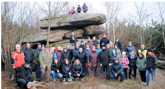
Velký čertův náramek v obležení pochoduujících