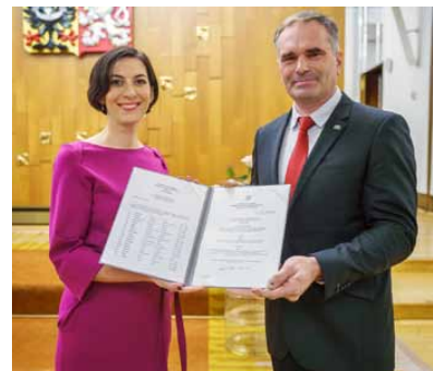
Dekret o předání znaku a vlajky obci Lom

Když jsem poprvé vstupoval do komunálních voleb v roce 2002, byl jsem nejdříve osloven předchozím zastupitelstvem, zda bych nechtěl kandidovat. Přemýšlel jsem, zda mám tento krok učinit či nikoliv. Nevěděl jsem, co mě bude přesně čekat a zda zvládnou rozhodování o důležitých věcech týkající se chodu obce v obecním zastupitelstvu a jak vše vlastně probíhá.