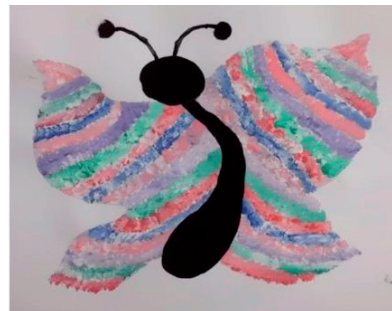
Kateřina Šemberová, 13 let, ZUŠ Blatná