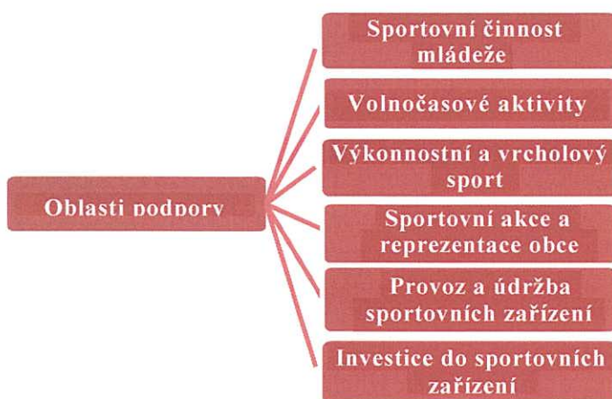
Obrázek 1: Oblasti podpory sportu